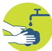
Často a důkladně si myjte ruce mýdlem a vodou