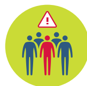
Vyhýbejte se zjevně nemocným a místům s vyšším počtem lidí