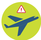
Necestujte do zasažených oblastí