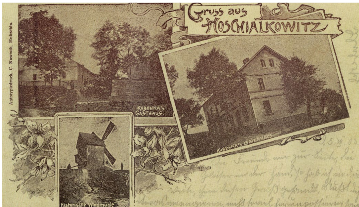
Pozdrav z Hošťálkovice (před rokem 1903).

pravnučka tehdejšího mlynáře Hošťálkovice