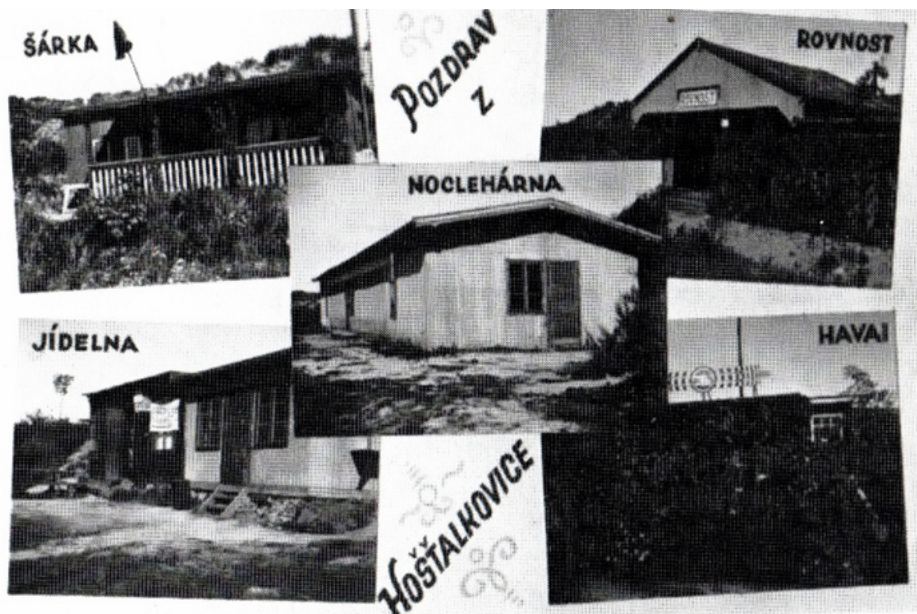
Na pohlednici z Hladového vrchu je zachycena noclehárna a kuchyň, kterou vybudoval sociálně-demokratický spolek v Hošťálkovicích „Nový život“. Objekt byl otevřen 31. srpna 1932.