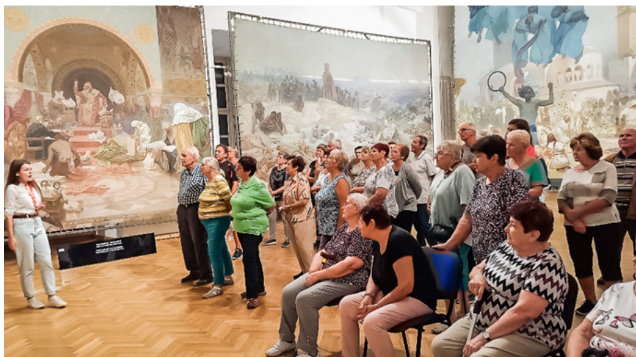
Senioři na prohlídce Slovanské epopeje v Mor. Krumlově