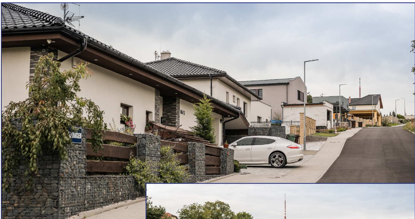
ulice Nad Dubíčkem ulice Jařabová ulice Výhledy