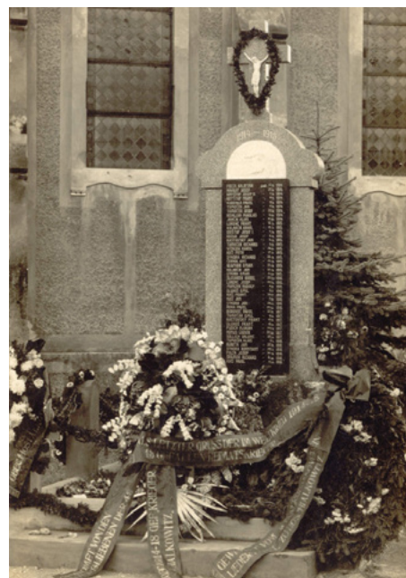
Památník padlým v 1. světové válce 1914-1918 u farního kostela Všech svatých