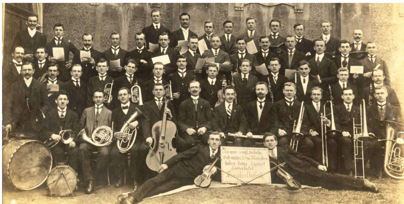
Mužský pěvecký spolek „Liedertafel“ Hošťálkovice