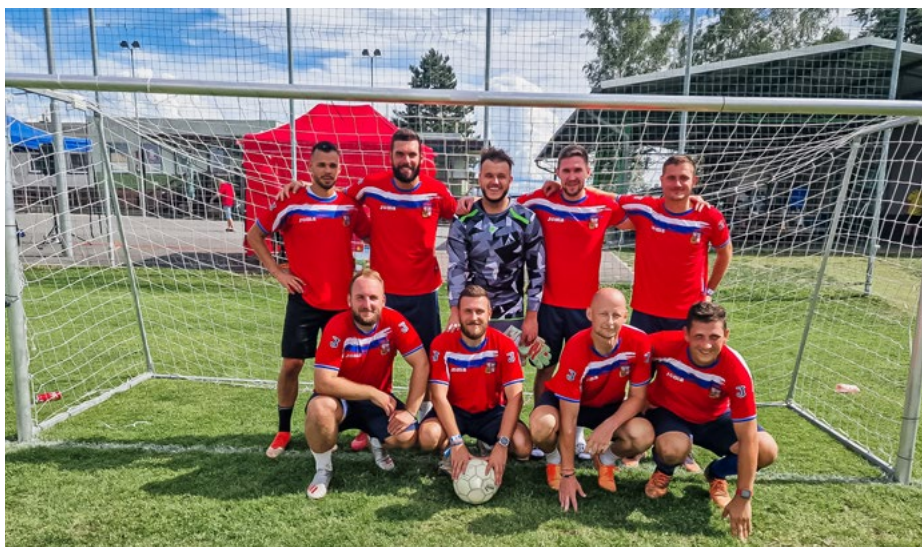
Jediný hošťálkovický zástupce v turnaji – tým Aleje.